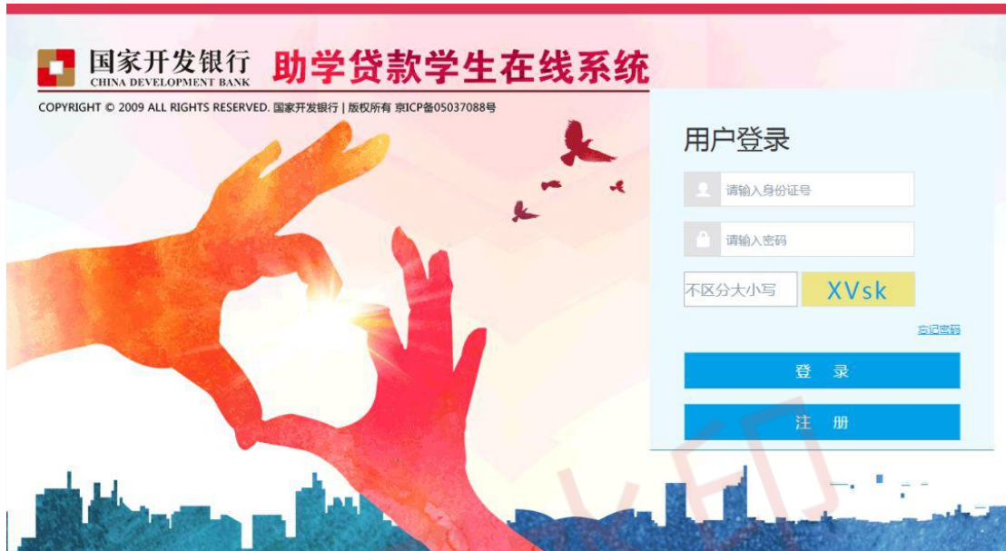
△学生在线服务系统登录界面

1. 登陆 https://s1s.cdb.com.cn , 点击“注册”, 弹出注册用户协议条款, 阅读后点击“同意”