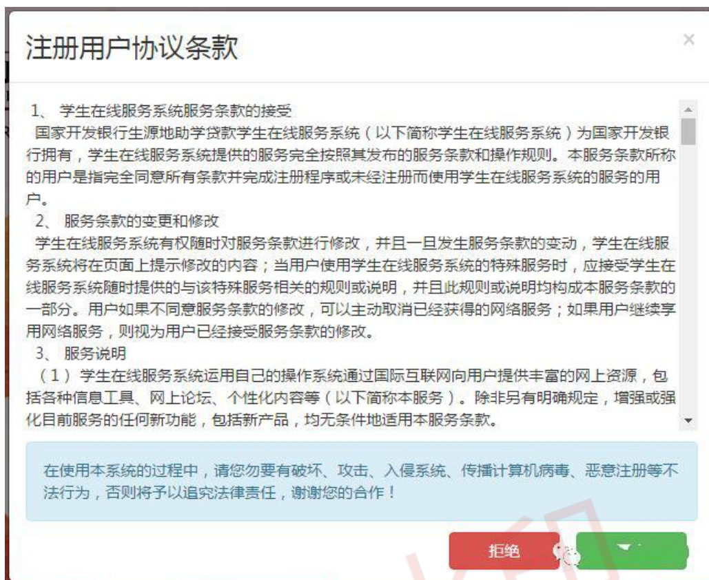
△学生在线服务系统新用户注册协议界面