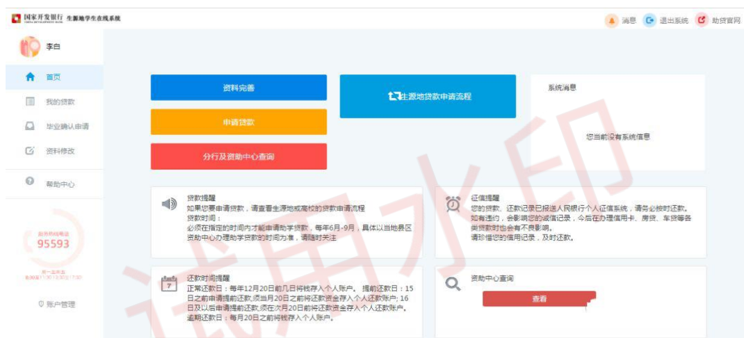
△学生在线服务系统新用户登录后界面

4. 也可以在助贷网站登录页输入身份证号、密码、验证码，点击登录按钮，登陆系统后，点击“资料完善”