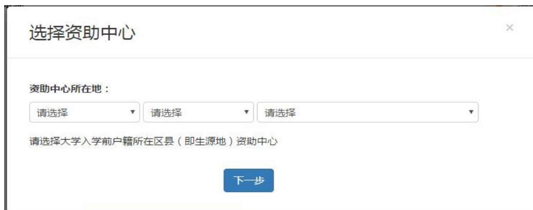
△学生在线服务系统新用户完善信息选择资助中心

5. 在弹出选择资助中心窗口内，选择大学入学前户籍所在区县级生源地资助中心，然后点击“下一步”